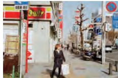
山内亮二 2011 「ウルトラナゴヤ」